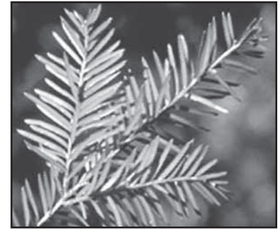
L'if du Canada — Taxus canadensis

La phase I de ce projet verra l'installation et le fonctionnement d'un système de propagation de l'if du Canada à la serre et à la pépinière du biocentre des Premières nations de Thessalon. Le biocentre a produit 35 000 plantes d'if du Canada. Six personnes ont été embauchées et formées pour exécuter le travail.